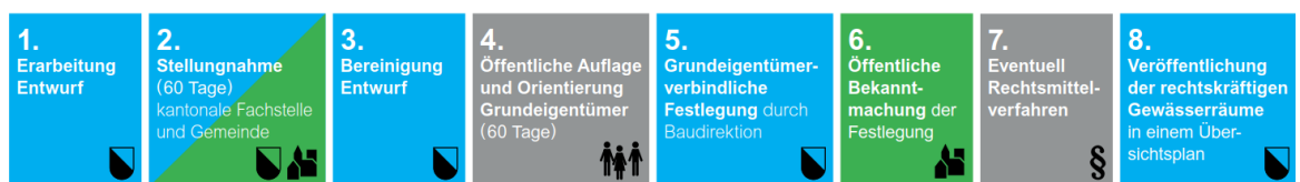
Abbildung 2: Ablauf Gewässerraumfestlegung.

Wenn der Gewässerraum vom Kanton grundeigentümergebunden festgelegt worden ist und keine Rekurse eingegangen sind, wird er rechtskräftig und in der kantonalen Gewässerraumkarte unter maps.zh.ch publiziert. Er ist somit jederzeit öffentlich einsehbar.