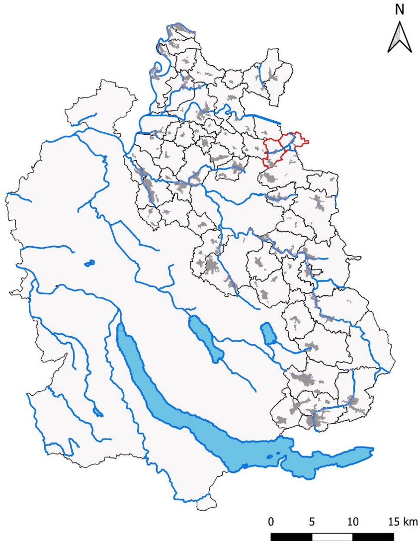
Abbildung 1: Dargestellt sind alle Gemeinden der 3. Priorität und deren Siedlungsgebiete (grau). Die rote Umrandung zeigt den Projektperimeter innerhalb dessen der Gewässerraum im Siedlungsgebiet am Schwarzbach/Ellikerbach in der 3. Priorität ausgeschieden wird.

Der Projektperimeter der Gewässerraumausscheidung am Schwarzbach/Ellikerbach in der 3. Priorität beinhaltet das Siedlungsgebiet der Gemeinden Rickenbach ZH und Ellikon an der Thur (Abbildung 1).